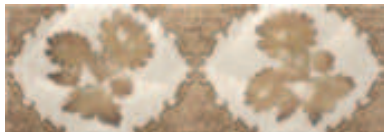
20216692 PANDORA-6 DEC-1 MARFIL 20x60cm. RV183