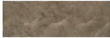
20216689 PANDORA-6 CHOCOLATE 20x60cm. RV166