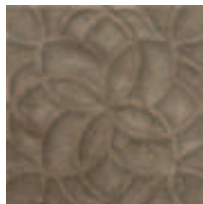
0202AA106 PANDORA CHOCOLATE DEC-3 31,6x31,6cm. RV205