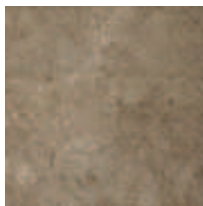
010113415 PANDORA CHOCOLATE 31,6x31,6cm. PV146