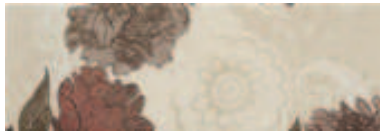
04DE4987 DECORADO BROCADO C MARFIL 20x60 cm. CR125