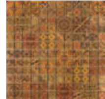
04MS170 MOSAICO PAN ORO CREMA 30x30cm. CR179