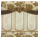
04CZ105 ZOCALO LUXURY MARFIL 20x20 cm. CR189