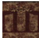
04CZ106 ZOCALO COBRE 20x20 cm. CR189