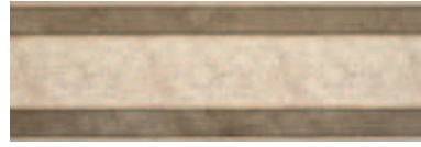
20216695 PANDORA DEC-2 CHOCOLATE 20x60cm. RV183