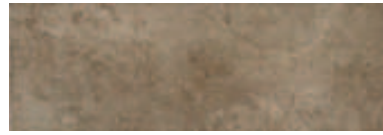
20216683 PANDORA CHOCOLATE 20x60cm. RV142