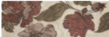
04DE4986 DECORADO BROCADO B MARFIL 20x60cm. CR125