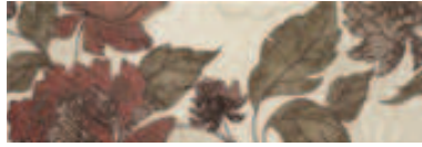
04DE4985 DECORADO BROCADO A MARFIL 20x60cm. CR125