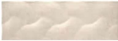
20216686 PANDORA-6 MARFIL 20x60cm. RV166