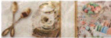
04DE4981 DECORADO DULCE B 20x60cm. CR150