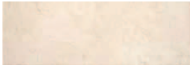
20216680 PANDORA MARFIL 20x60cm. RV142