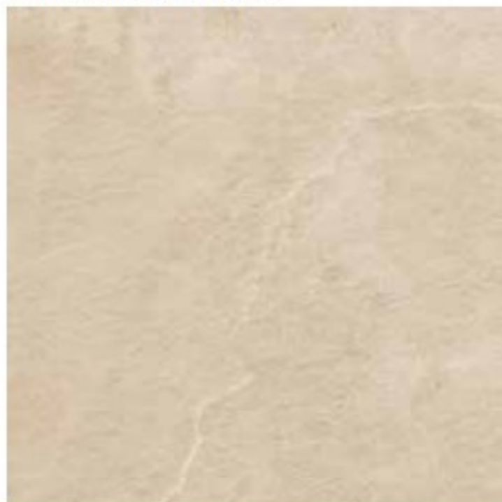
Материя Магнезио X2 / Materia Magnesio X2