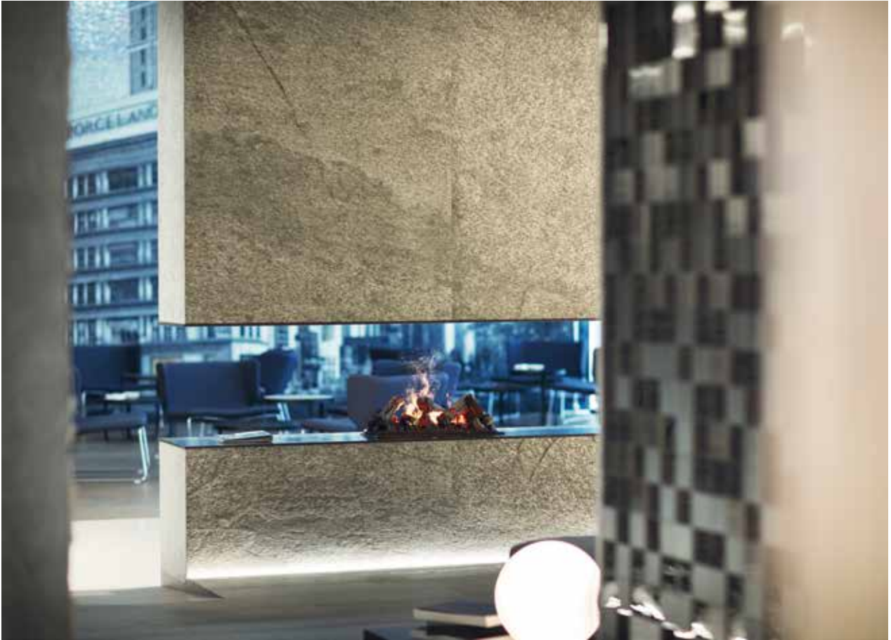
PRODUCTOS / PRODUCTS: Airslate Metal, Metal Acero Anthracite 3D Cubes