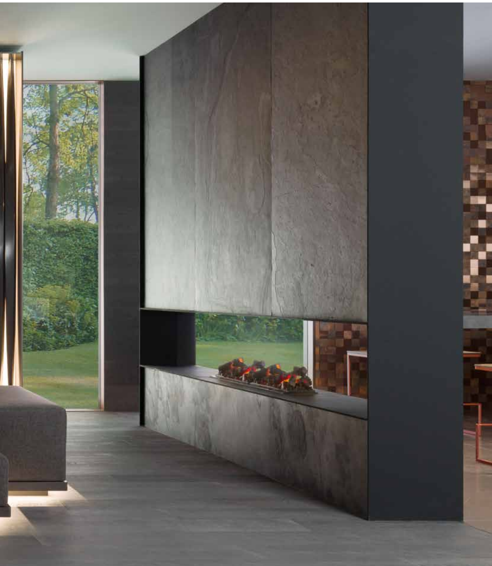
PRODUCTOS / PRODUCTS: Airslate Graphite, Authentic 1L Anthracite