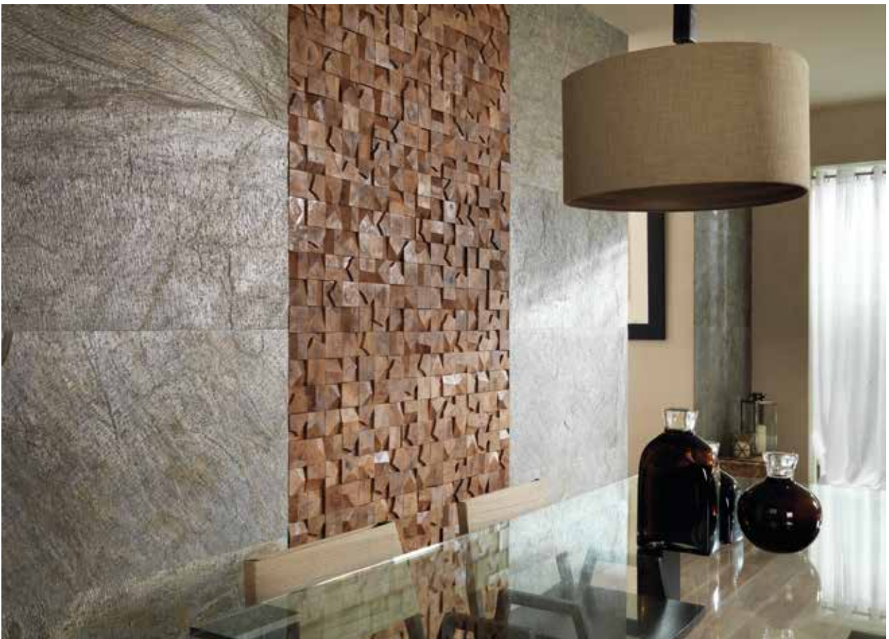
PRODUCTOS / PRODUCTS: Airslate Delhi, Wood Cubes