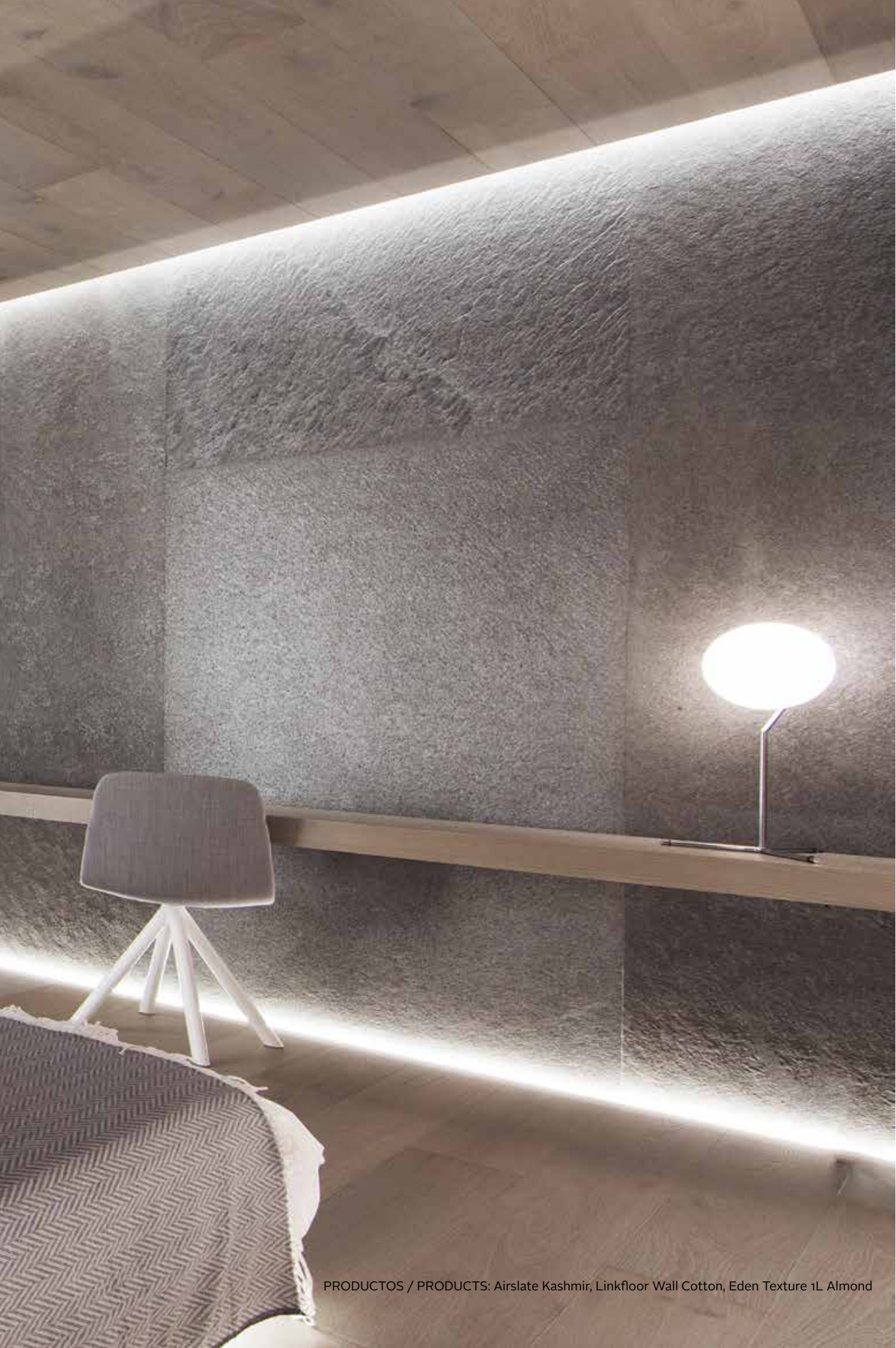
PRODUCTOS / PRODUCTS: Airslate Kashmir, Linkfloor Wall Cotton, Eden Texture 1L Almond