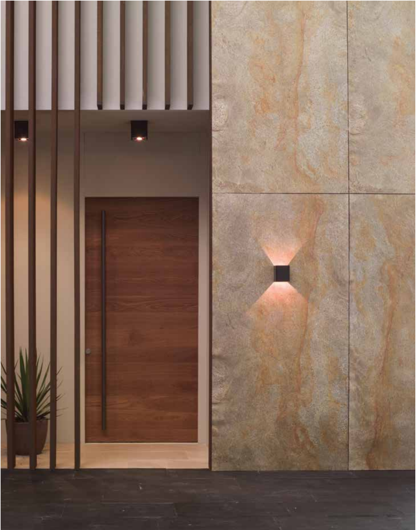
PRODUCTOS / PRODUCTS: Airslate Kathmandu, Bhutan, Desert