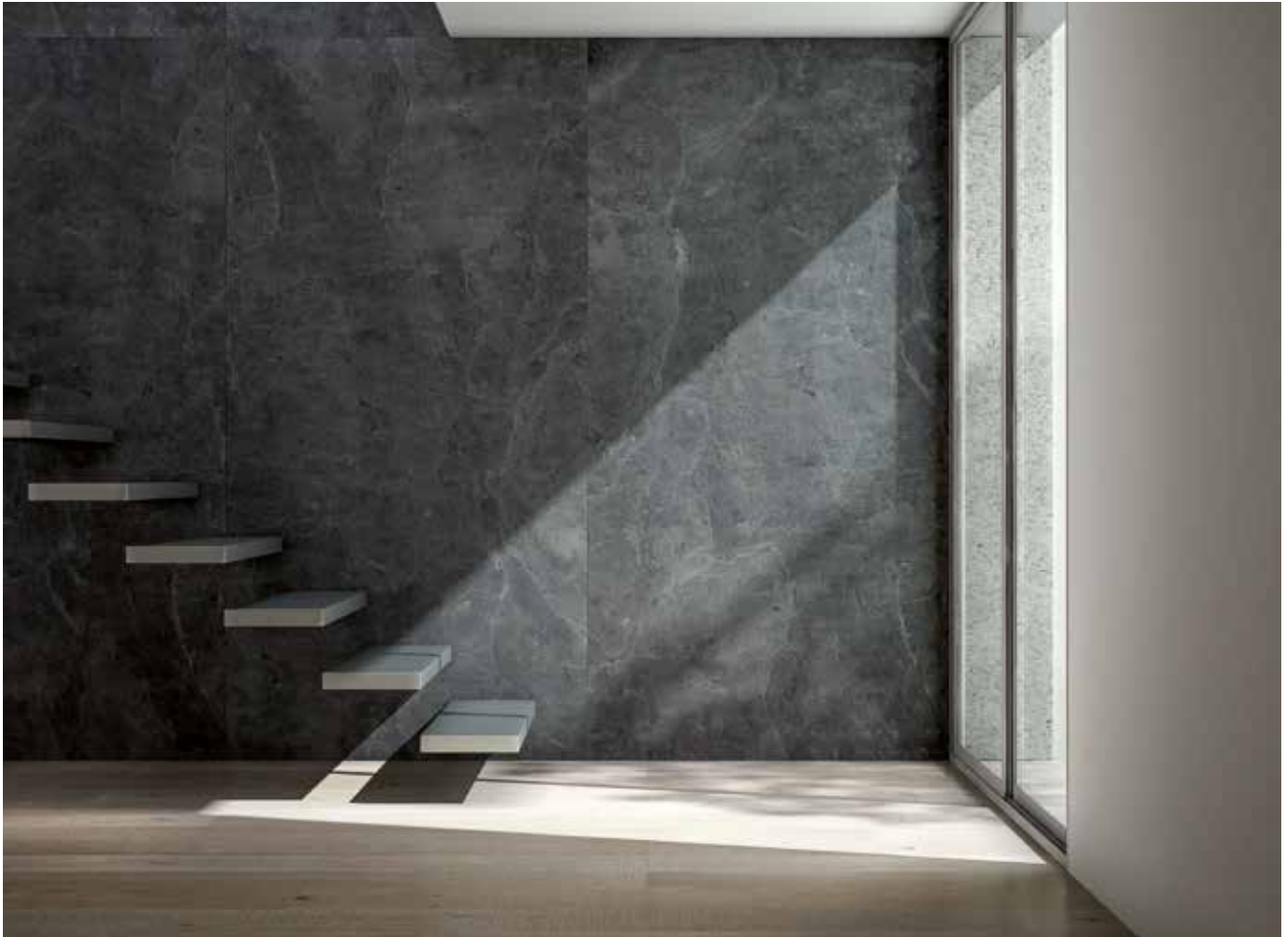
PRODUCTOS / PRODUCTS: Airslate Graphite