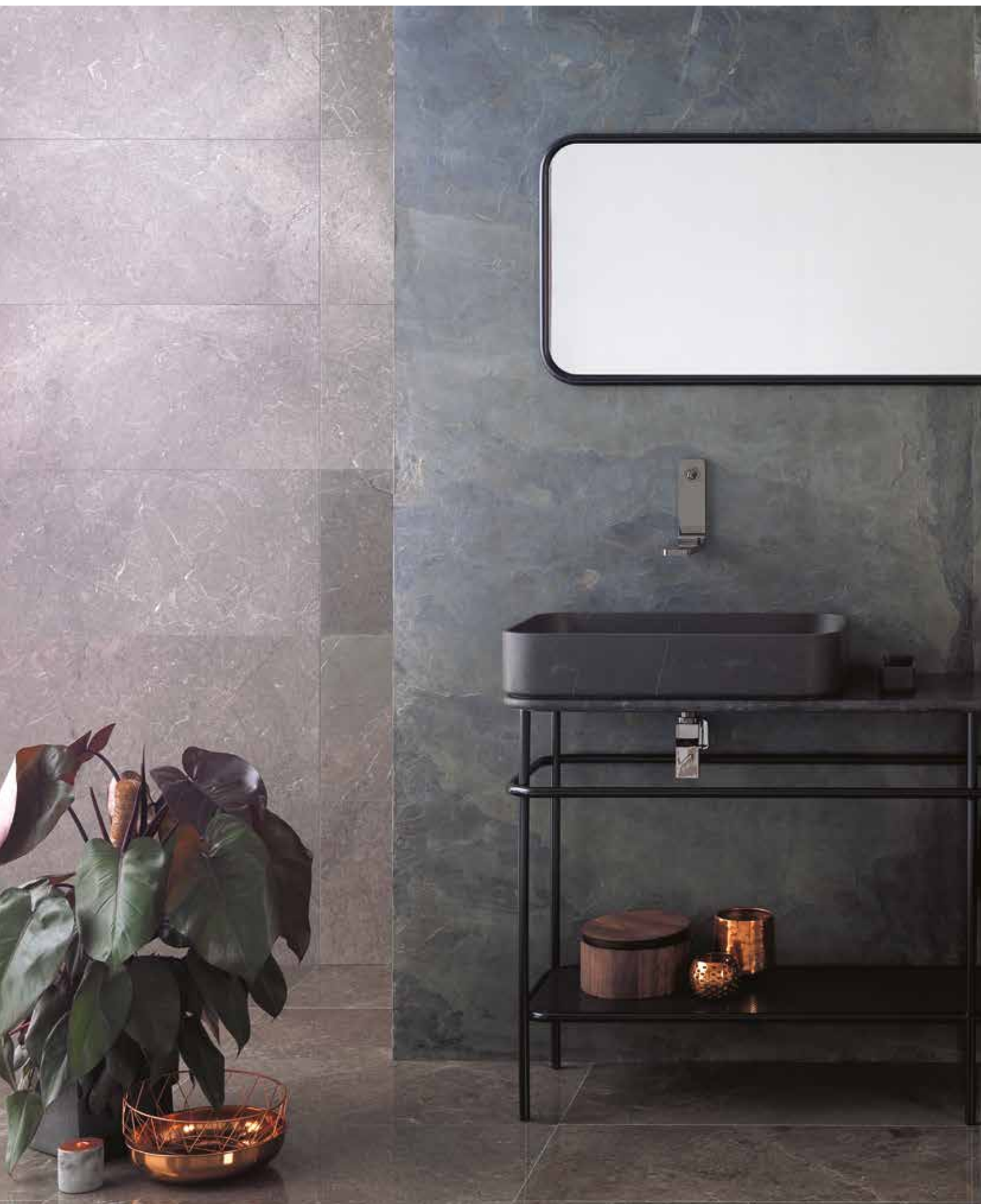
PRODUCTOS / PRODUCTS: Airslate Forest, Habana Grey, Colección Vintage