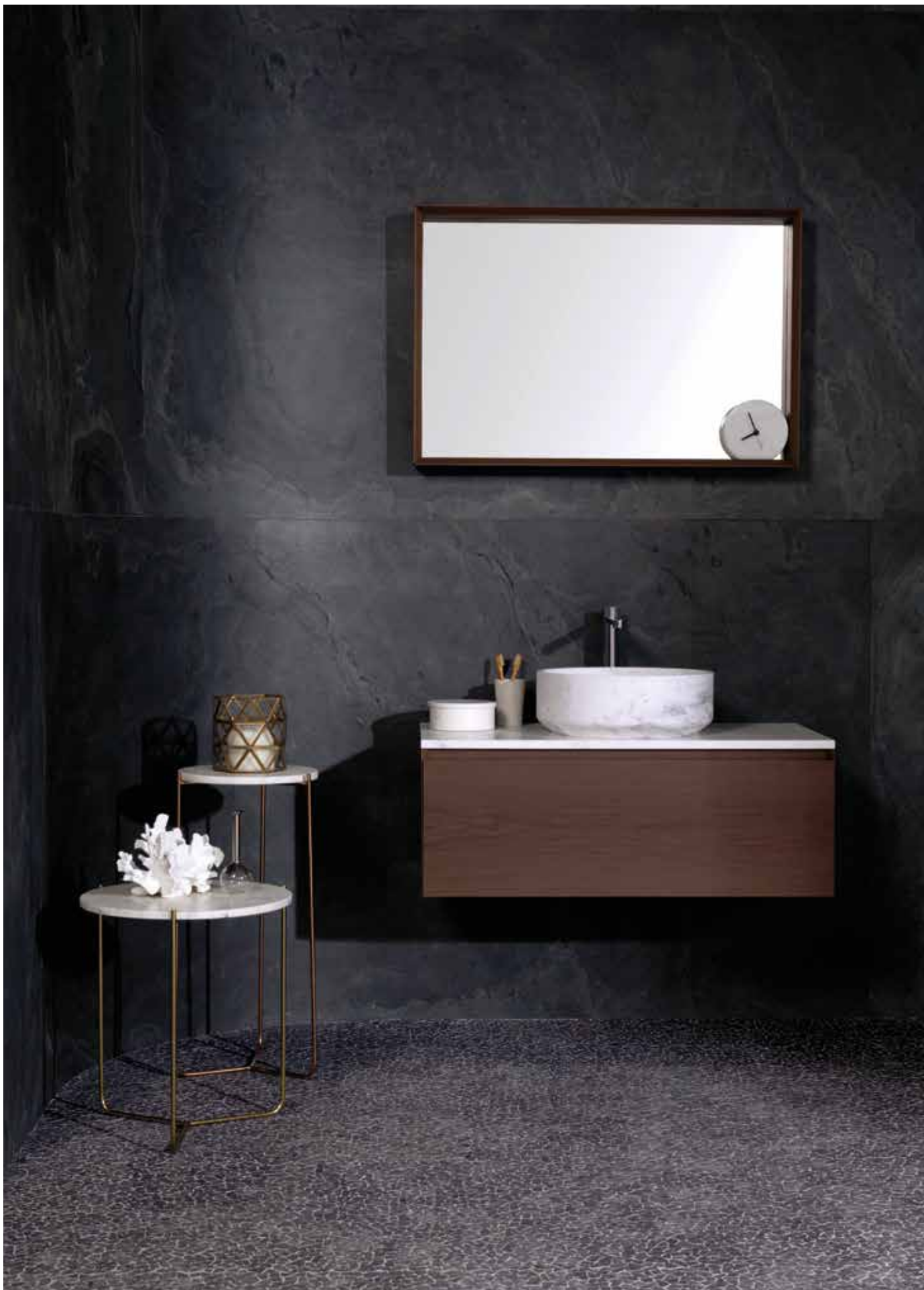
PRODUCTOS / PRODUCTS: Airslate Graphite