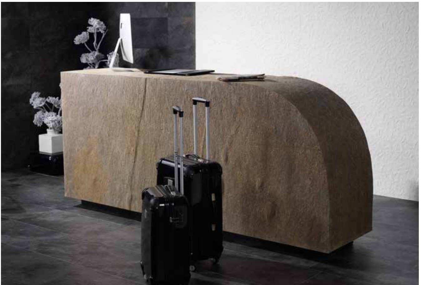
PRODUCTOS / PRODUCTS: Airslate Kathmandu