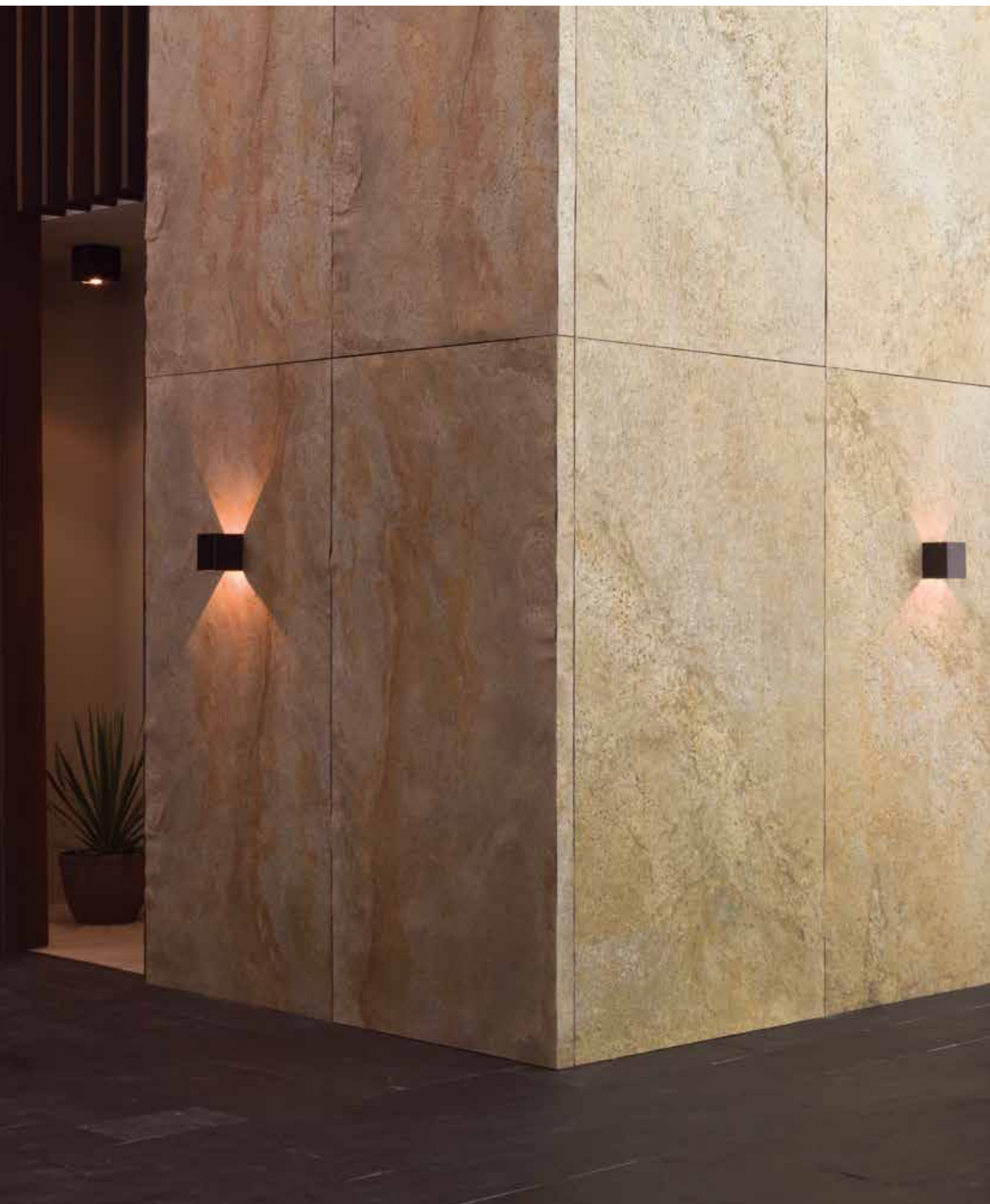
PRODUCTOS / PRODUCTS: Airslate Kathmandu, Globe Wall Bhutan, Bhutan, Desert