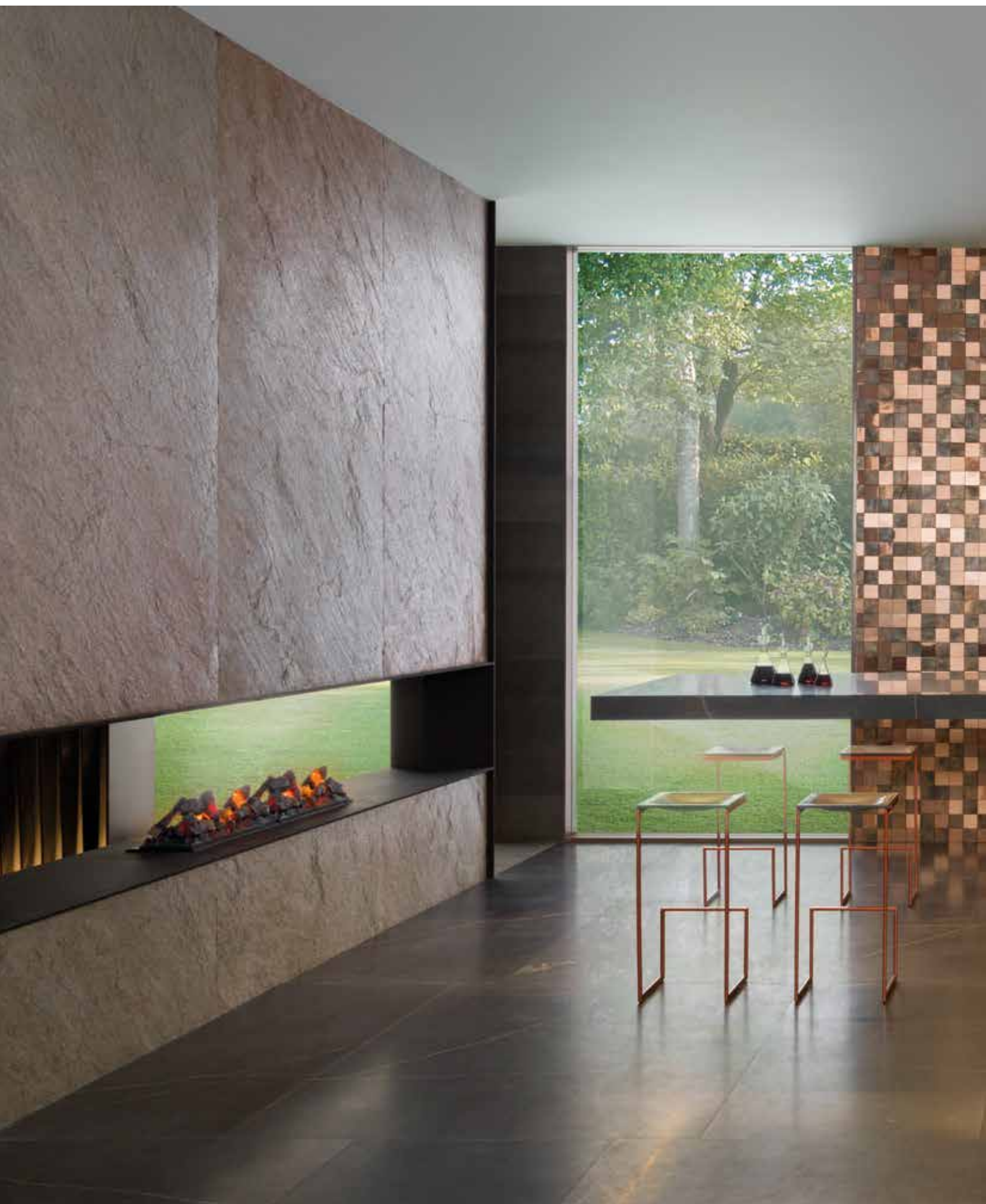
PRODUCTOS / PRODUCTS: Airslate Bombay, Metal Bronze 3D Cubes, Habana Dark