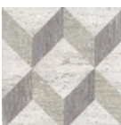
AD/B393/TU6001 Колор Вуд серый 13x13 Color Wood grey