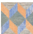
AD/A393/TU6001 Колор Вуд микс 13x13 Color Wood mix