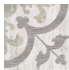
AD/B394/TU6001 Колор Вуд серый 13x13 Color Wood grey