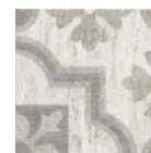
AD/B395/TU6001 Колор Вуд серый 13x13 Color Wood grey