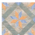
AD/A392/TU6001 Колор Вуд микс 13x13 Color Wood mix