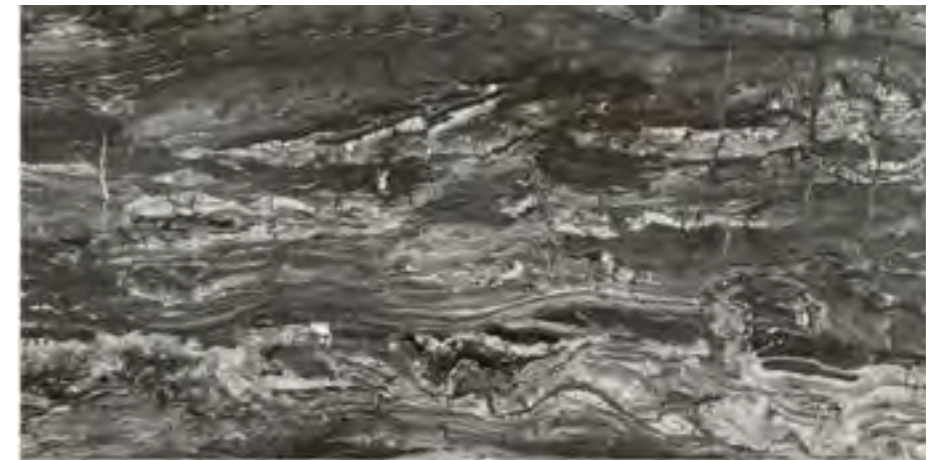
60 X 120 / 24 x 48"