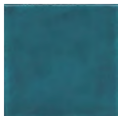
5242 Капри зеленый темный 20x20 Capri dark green