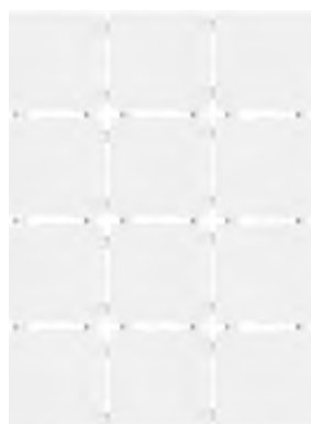
1230 Конфетти белый, матовый, полотно 30x40 из 12 частей 9,9x9,9 Confetti white, matt