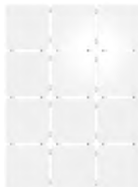
1146 Конфетти белый, блестящий, полотно 30x40 из 12 частей 9,9x9,9 Confetti white, shiny