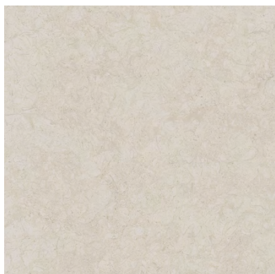
SG642700R Веласка беж светлый обрезной 60x60 Velasca light beige rectified