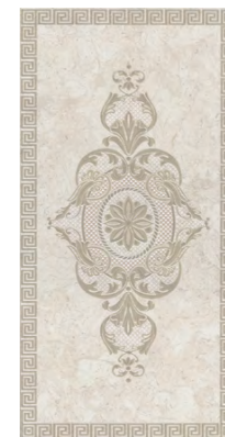
VTVA150\11199R Веласка обрезной 30x60 Velasca rectified