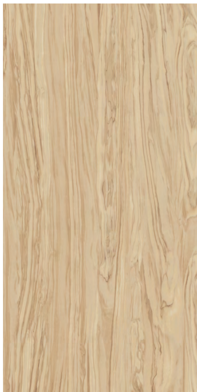
SG565200R Олива бежевый обрезной 60x119,5 Oliva beige rectified