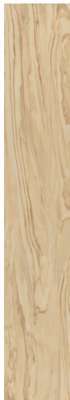
SG516200R Олива бежевый обрезной 20x119,5 Oliva beige rectified