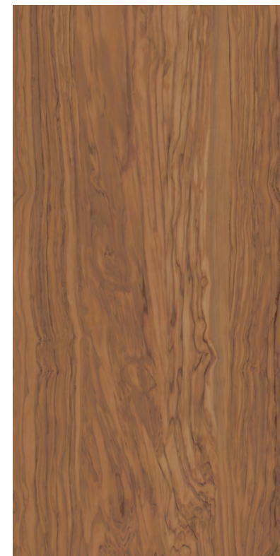
SG565300R Олива коричневый обрезной 60x119,5 Oliva brown rectified