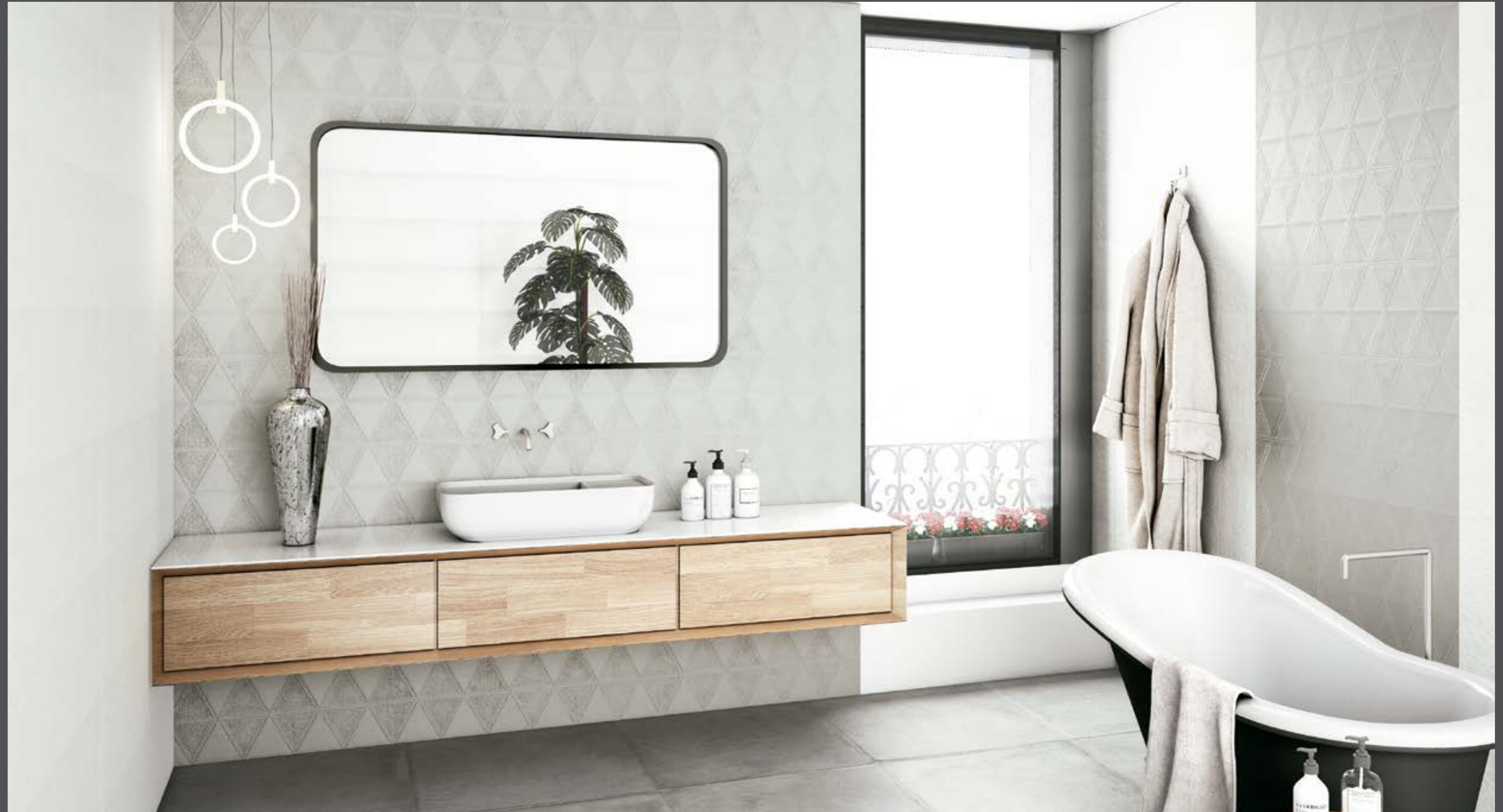
TEX WHITE · FELP ASH

SUGGESTED FLOOR · TEX COLLECTION · 60x60