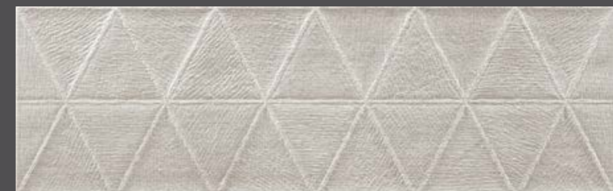
FELP ASH 31x98