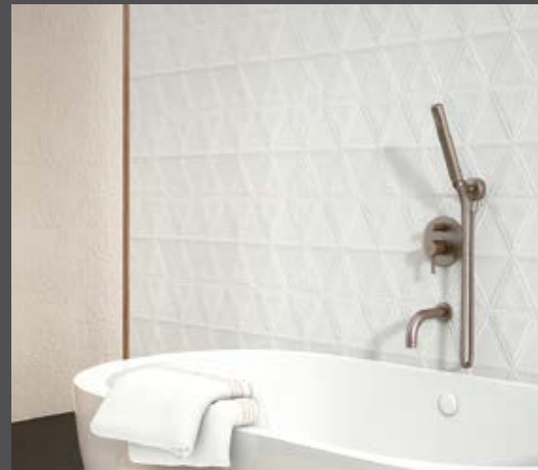
FELP WHITE · TEX NATURAL