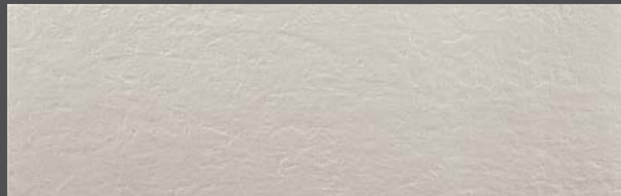
TEX ASH 31x98