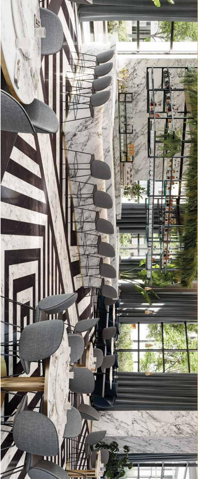
Marble piece of green classicism defined by its natural brightness melted with the intertwining of branches of greyish shade. Pieza de mármol de gran classicismo definido por su brillo natural fundido con el entresijo de ramas de tonalidad grisácea. Pieza de mármore de gran classicismo definida por seu brilho natural fundido com o entresijo de ramos de tonalidade grisácea.