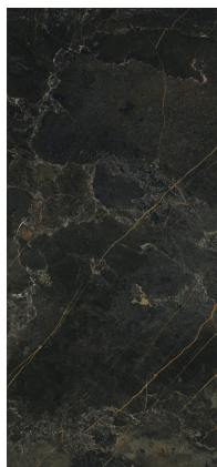
ICARO DARK PULIDO XL2612GRP