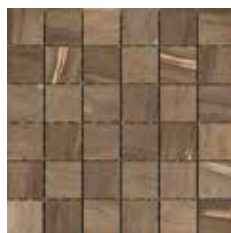
MOSAICO DESERT 5x5 - 2"x2"

in fogli 30,5x30,5 - 12"x12" NATURALE in fogli 30x30 - 12"x12" LAPPATO/RETTIFICATO