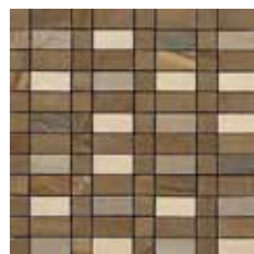
MOSAICO INTRECCIO MIX

Mosaico 5x5 in fogli da 36 pezzi 5x5 - 2"x2" mosaic in sheets made up of 36 pieces Mosaik 5x5 auf Blatt mit 36 Stück Mosaïque de 5x5 sur feuille tramée de de 36 pièces Мозаика 5x5 в листах состоящих из 36 фрагмента