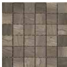
MOSAICO DARK 5x5 - 2"x2"

in fogli 30,5x30,5 - 12"x12" NATURALE in fogli 30x30 - 12"x12" LAPPATO/RETTIFICATO