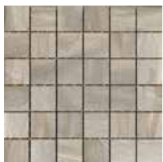
MOSAICO SHADOW 5x5 - 2"x2"

in fogli 30,5x30,5 - 12"x12" NATURALE in fogli 30x30 - 12"x12" LAPPATO/RETTIFICATO