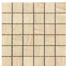
MOSAICO RAY 5x5 - 2"x2"

in fogli 30,5x30,5 - 12"x12" NATURALE in fogli 30x30 - 12"x12" LAPPATO/RETTIFICATO