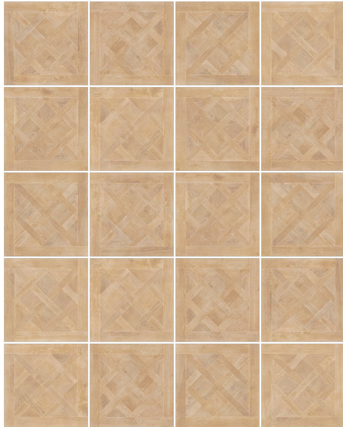
PATTERNS VARIETY VARIEDAD GRÁFICA WISTMAN OAK HONEY 90x90 cm FORMAT WISTMAN OAK HONEY FORMATO 90x90 cm