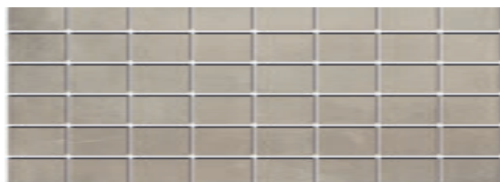
MM15114 Пикарди беж мозаичный 15x40 Picardy beige mosaic