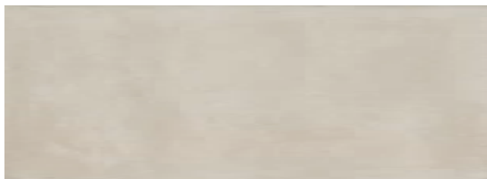
15100 Пикарди светлый 15x40 Picardy light