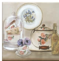
HGD/A243/17000 Пикарди Кухня 15x15 Picardy Kitchen