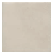
17026 Пикарди светлый 15x15 Picardy light