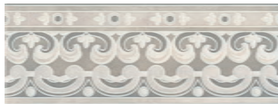
HGD/A316/15000 Пикарди 15x40 Picardy