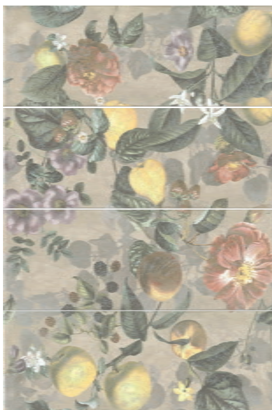
HGD/A246/4x/15000 Пикарди Сад, панно из 4 частей 15x40 (размер каждой части) Picardy Garden, decorative panel