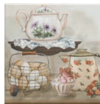
HGD/A244/17000 Пикарди Кухня 15x15 Picardy Kitchen