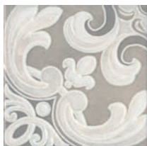
HGD/A315/17000 Пикарди 15x15 Picardy