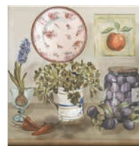
HGD/A245/17000 Пикарди Кухня 15x15 Picardy Kitchen