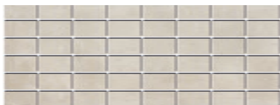
MM15113 Пикарди светлый мозаичный 15x40 Picardy light mosaic