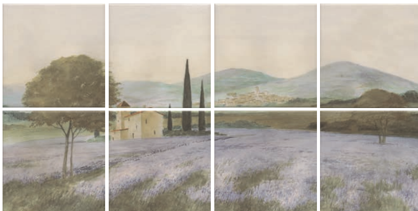
VB/A08/8x/17000 Пикарди Лавандовое поле, панно из 8 частей 15x15 (размер каждой части) Picardy Lavender field, decorative panel