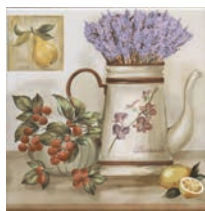
HGD/A242/17000 Пикарди Кухня 15x15 Picardy Kitchen