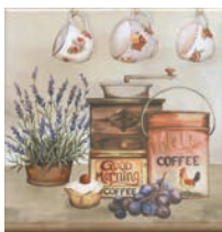
HGD/A241/17000 Пикарди Кухня 15x15 Picardy Kitchen