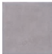
17027 Пикарди сиреневый 15x15 Picardy lilac