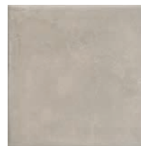
17028 Пикарди беж 15x15 Picardy beige