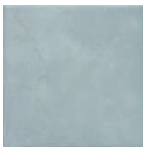
17024 Пикарди голубой 15x15 Picardy light blue