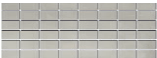
MM15112 Пикарди серый мозаичный 15x40 Picardy grey mosaic