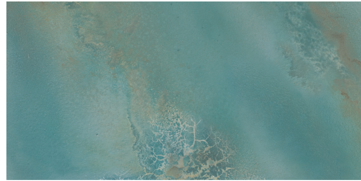
HYDRA AQUA 60 X 120 / 24" X 48" REC. SSHINE