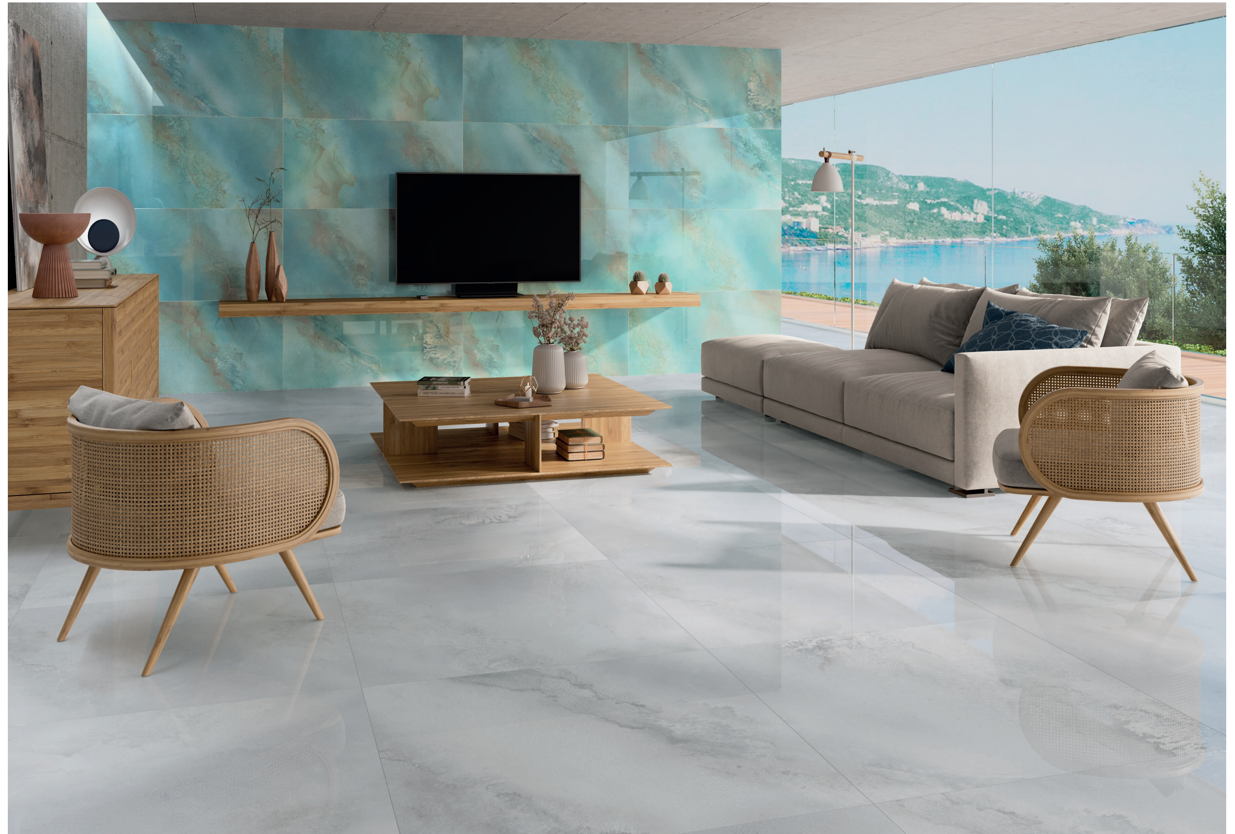
Wall Tile / Revestimiento HYDRA AQUA 60 X 120 REC. SSHINE Floor Tile / Pavimento HYDRA WHITE 90 X 90 REC. SSHINE

Además de por sus finas arenas blancas y sus aguas de color esmeralda, el entorno de Cala Conta destaca por la hilera de islotes que flotan en el horizonte más próximo. Esta refrescante colección en acabado Super Shine, se compone de 2 colores que recuerdan a la perfección la Cala Conta. El color Aqua hace referencia al color del agua en sus diferentes tonalidades jugando con los arrecifes. El color blanco es un homenaje a la fina arena blanca que recubre sus playas.