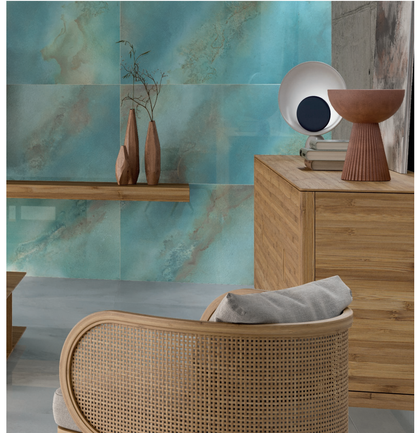
Wall Tile / Revestimiento HYDRA AQUA 60 X 120 REC. SSHINE