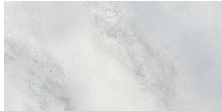
HYDRA WHITE 60 X 120 / 24" X 48" REC. SSHINE