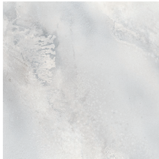
HYDRA WHITE 90 X 90 / 36" X 36" REC. SSHINE