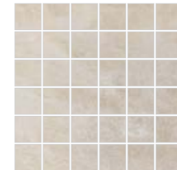
Malla Lab. Naica 30x30 (5x5)