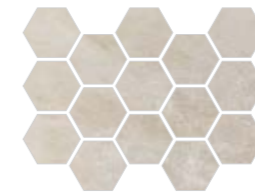
Malla Hex Lab. Naica 32,5x22,5