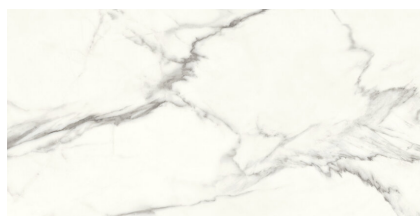
SIENA WHITE PULIDO PS6012P