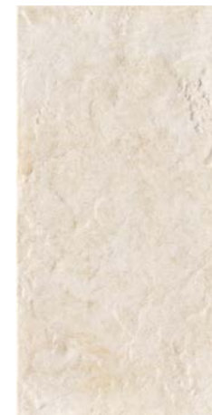
POMPEI 36B 30x60 - 12"x24"