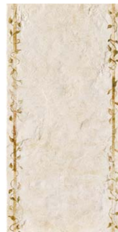
POMPEI4 36B1 30x60 - 12"x24"