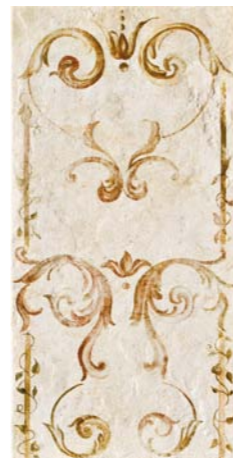
POMPEI5 36B1 30x60 - 12"x24"