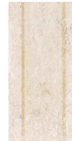
ELEGANTIA2 36B1 30x60 - 12"x24"