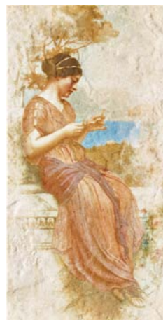
POMPEI1 36B1 30x60 - 12"x24"