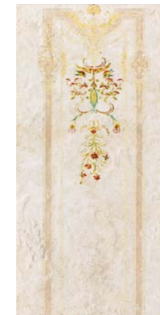
ELEGANTIA1 36B1 30x60 - 12"x24"