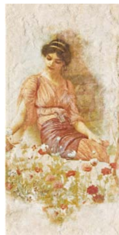
POMPEI2 36B1 30x60 - 12"x24"