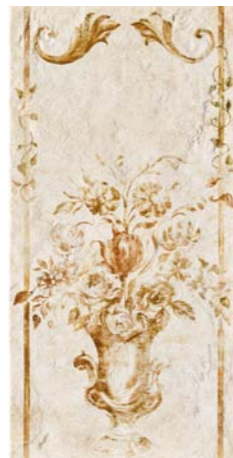
POMPEI6 36B1 30x60 - 12"x24"