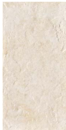
POMPEI 36B 30x60 - 12"x24"