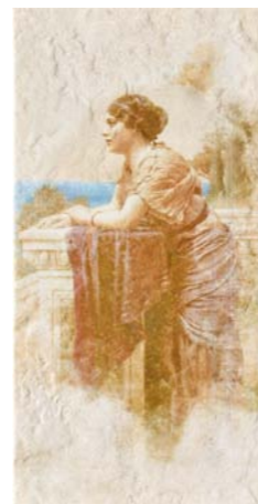
POMPEI3 36B1 30x60 - 12"x24"