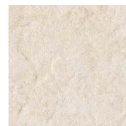
POMPEI 33B 33,3x33,3 - 13.1"x13.1"