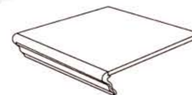
Gradino 20x20 cm - 8"x8"