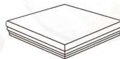
Angolare 20x20 cm - 8"x8"