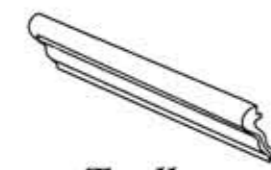
Torello 6x20 cm - 2"x8"